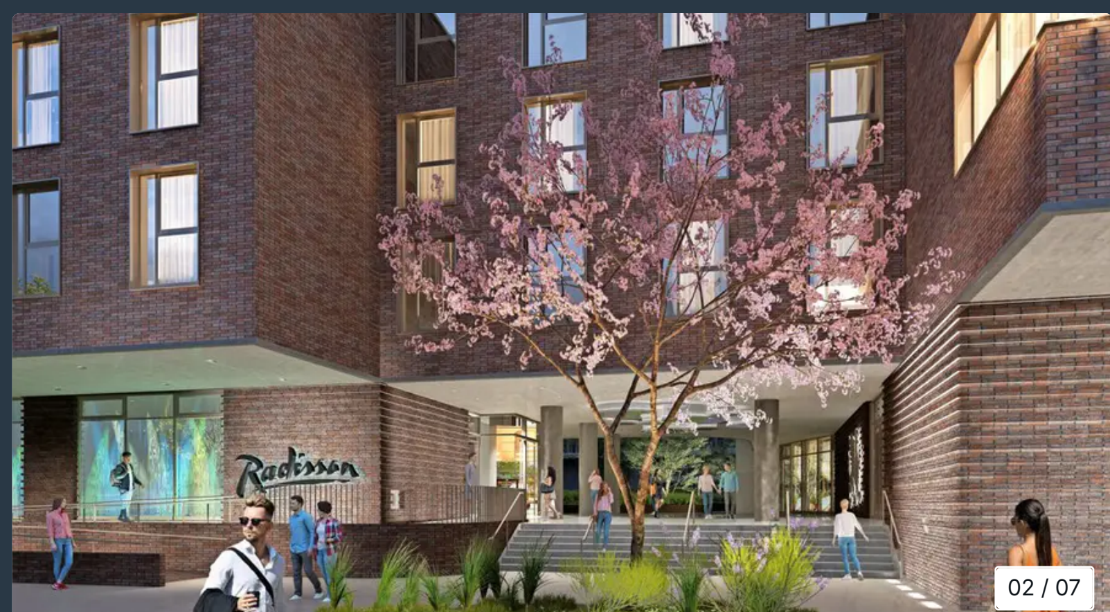
Der Hoteleingang und Durchgang zu den Terrassen des Restaurants und dem Brauhaus wird modern gestaltet.