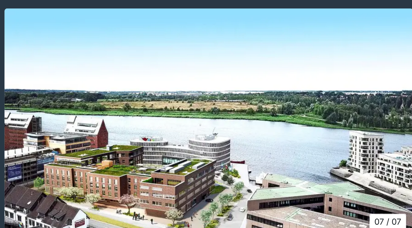
Blick vom Turm der Petrikerche in Richtung des neuen Radisson Blu