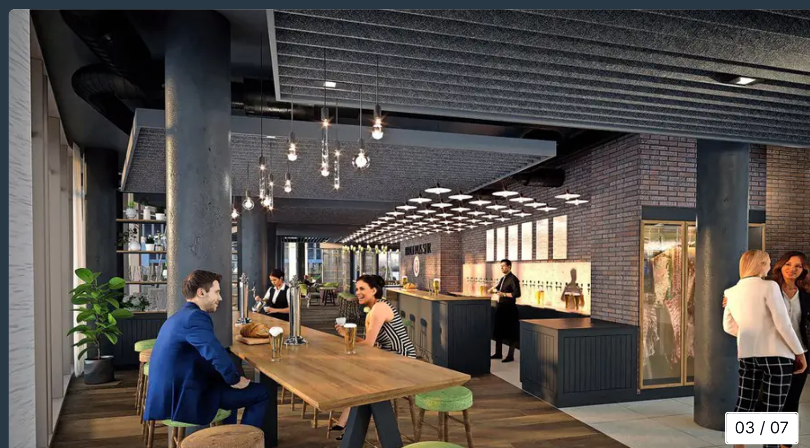
Modern und gemütlich sollen Gäste im Brauhaus im neuen Radisson sitzen können.