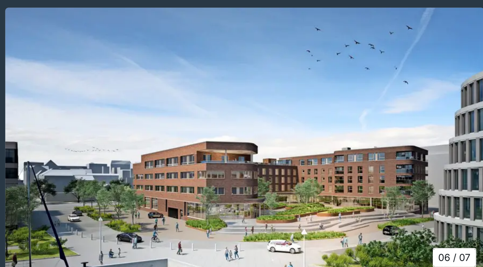
Blick vom Ludewigbecken zum Innenhof des Hotels