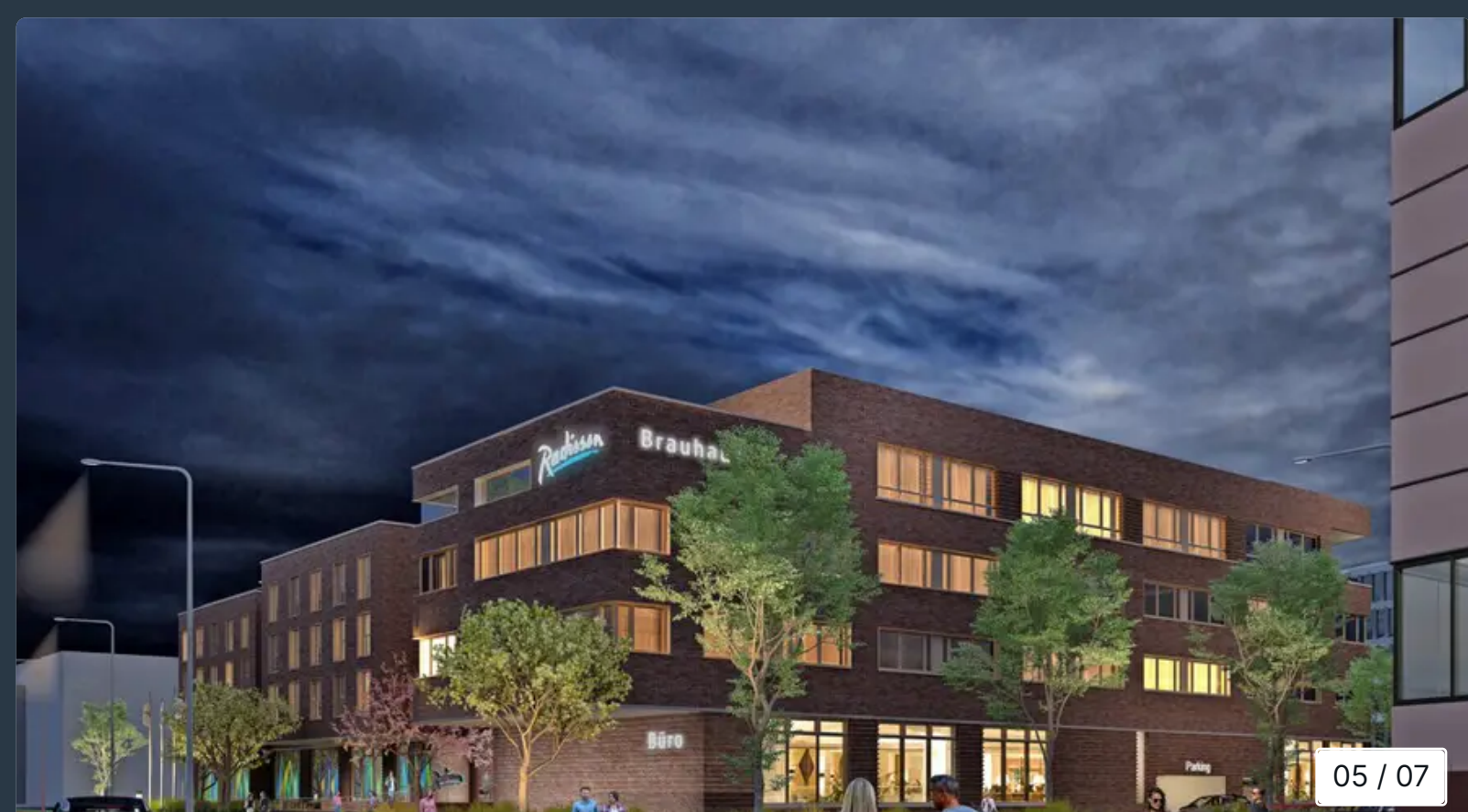
Eine Visualisierung der Abendansicht von der Straße „Am Strande“ Richtung Stadthafen