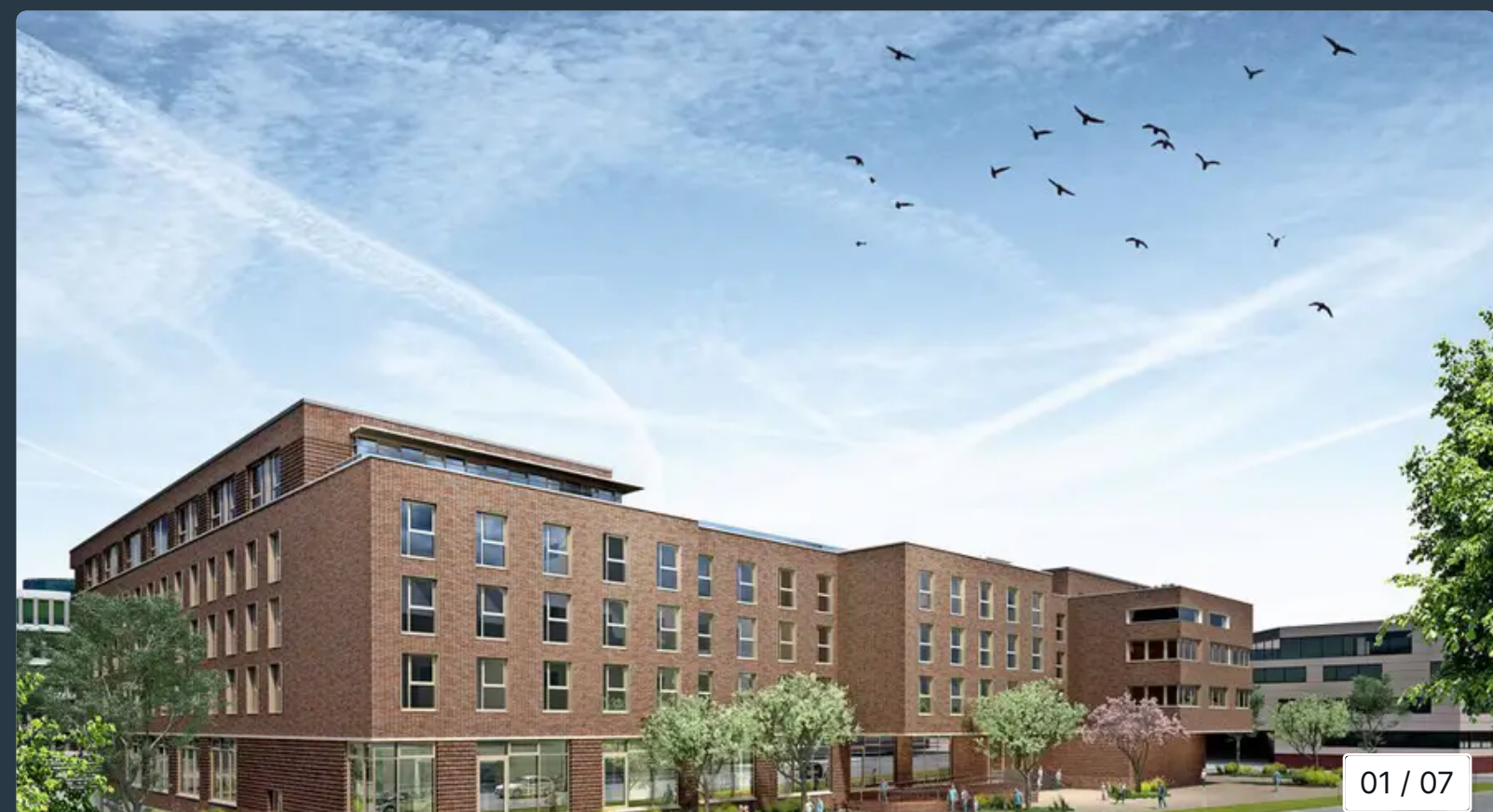
So soll das Hotel von der Straße „Am Strande“ aus Richtung Warnow aussehen.

Bildergalerie: Die schönsten Leserfotos aus dem September 2023